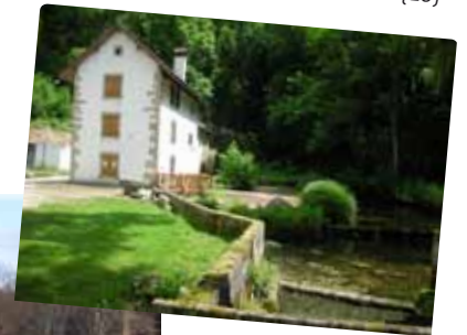
Moulin de la Doue (25)