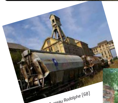
Carreau Rodolphe (68)