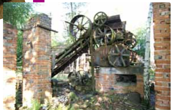
Tuilerie Sonntag (67)